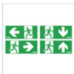
3893 ADES C.6/11->3292+93+3297