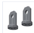
3723 GANCIO SOSPENSIONE 4004/PR