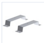
2751 KIT INST CONTROSOFO COMPL