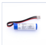
415437001 LI-FEPO4 3.2V 0.5AH 14500