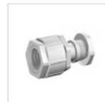
3727 GR PRESSATU 16/20-4003/RG