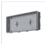
2741 INC COMPLETA 6-11 3974/IP