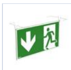
4128 SCHERMO BAND PRATICA BS