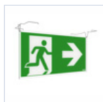
4127 SCHERMO BAND PRATICA SX/DX