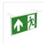
4129 SCHERMO BAND PRATICA UP