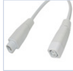
424020005 CONN PLUG 1.5MT RGL LEDECO