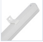
424020004 GR ACCESSORY RGL LEDECO