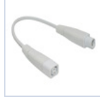
424020003 CONNECTION PLUG 150 RGL LEDECO