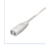
424020006 MAIN POWER L1500 REGLED ECO