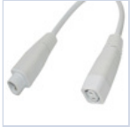
424020009 CONNECTION PLUG 2MT RGL LEDECO