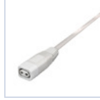
424020006 MAIN POWER L1500 REGLED ECO