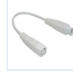
424020003 CONNECTION PLUG 150 RGL LEDECO