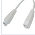
424020005 CONN PLUG 1.5MT RGL LEDECO