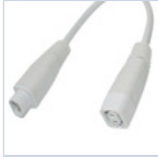
424020009 CONNECTION PLUG 2MT RGL LEDECO