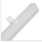
424020004 GR ACCESSORY RGL LEDECO