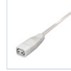
424020006 MAIN POWER L1500 REGLED ECO