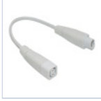
424020003 CONNECTION PLUG 150 RGL LEDECO