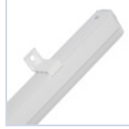
424020004 GR ACCESSORY RGL LEDECO