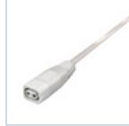
424020006 MAIN POWER L1500 REGLED ECO