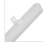
424020004 GR ACCESSORY RGL LEDECO