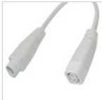
424020009 CONNECTION PLUG 2MT RGL LEDECO