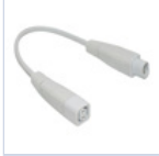
424020003 CONNECTION PLUG 150 RGL LEDECO