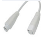
424020005 CONN PLUG 1.5MT RGL LEDECO